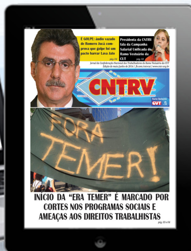
INÍCIO DA “ERA TEMER” É MARCADO POR CORTES NOS PROGRAMAS SOCIAIS E AMEAÇAS AOS DIREITOS TRABALHISTAS