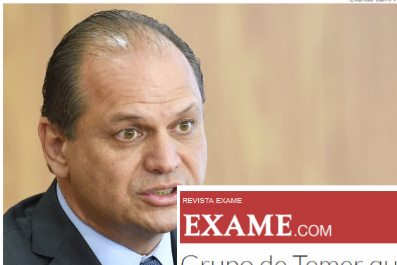
O ministro da Saúde do governo Temer, Ricardo Barros

Tamanho do SUS precisa ser revisto, diz novo ministro da Saúde