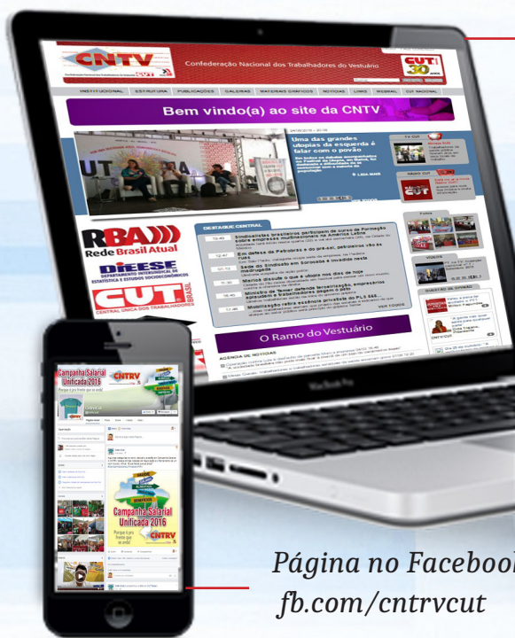
Página no Facebook fb.com/cntrvcut

Restringiu programas como Fies e Pronatec; aponta para a privatização total dos ensinos médio e superior, bem como o fim do Piso Nacional dos Professores.